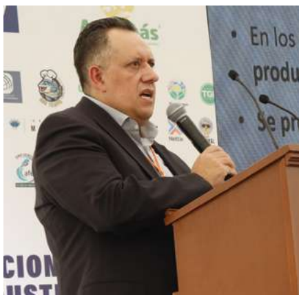
Ponentes el primer día de conferencias magistrales.