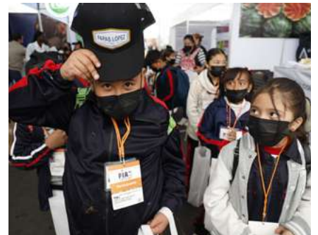
Expositores, autoridades de Canacindra y visitantes al FIA 2023