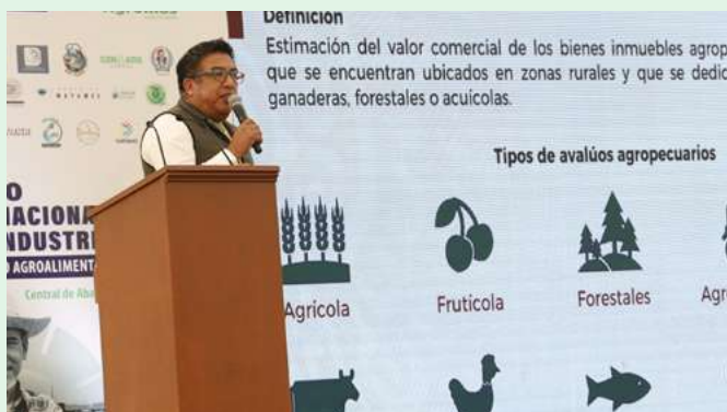
La interacción con estudiantes estuvo presente en las mesas temáticas, así como exposiciones sobre sanidad agroindustrial.