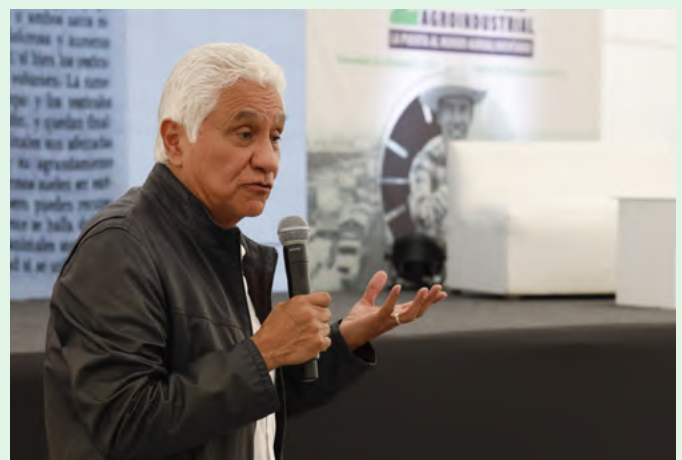
Momentos de mesas temáticas durante los cuatro días de actividades del FIA 2023.