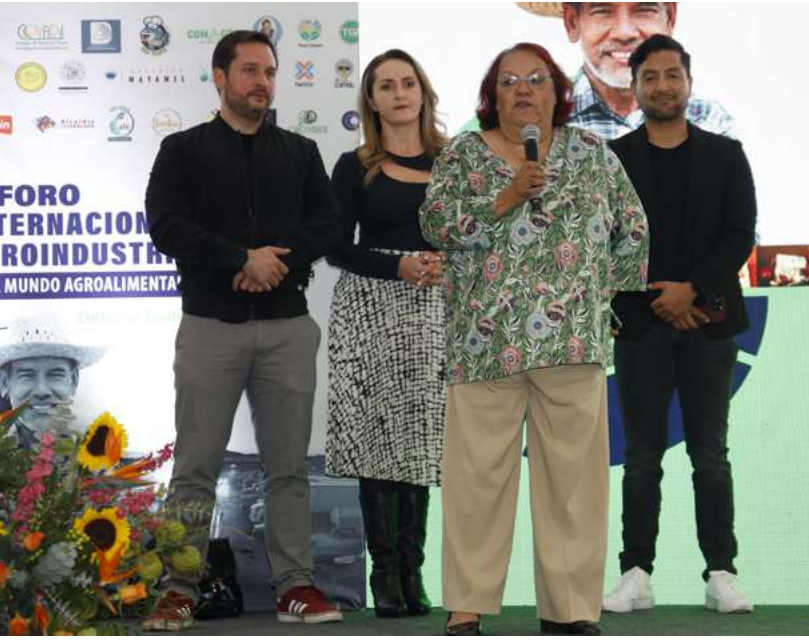
Funcionarios y líderes de CEDA colaboraron de manera estrecha para la realización del FIA 2023