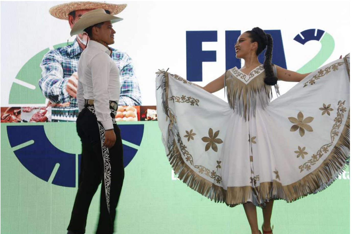
Baile tradicional mexicano durante la inauguración del FIA 2023

Como resultado de un arduo trabajo para crear el Foro Internacional Agroindustria, iniciativa que surge dentro del Sector Agroindustrial de la Cámara Nacional de la Industria de la Transformación, nacen también las Memorias del 2do Foro Internacional Agroindustrial en formato revista, como un ejercicio de comunicación permanente derivado del FIA, publicación que tiene el objetivo no únicamente de conmemorar la realización de cada una de las ediciones de este Foro, sino también de hacer un detallado seguimiento al proceso continuo que requiere la realización de las distintas ediciones de nuestra evento.