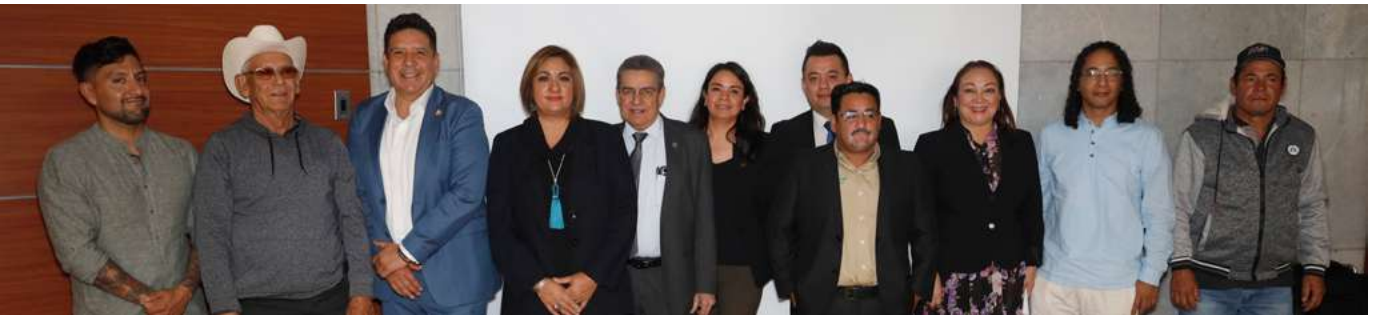
Toma de juramento de presidencias y vicepresidencias de ramas del sector Agroindustrial de Canacintra.

Estas siete ramas son: Rama 14, Agroindustria de Tipo Inspección Federal; Rama 49, Fabricantes de Alimentos Balanceados para Animales; Rama 71, Productores Agropecuarios, Forestales, Acuícolas, Pesqueros y Apícolas; Rama 73, Procesadores y Transformadores de Productos