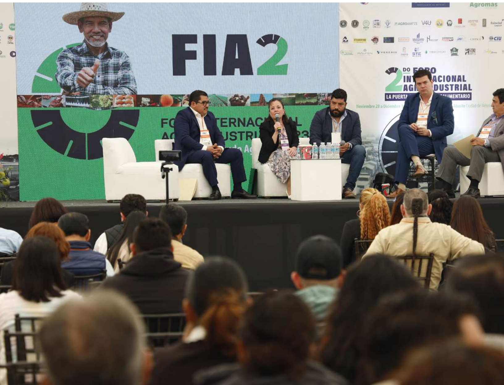
Miembros de la Unión de Comerciantes en Frutas, Legumbres, Abarrotes y Locales Comerciales de la Central de Abasto participaron en la primera mesa temática.

Que este FIA, y los próximos, germinen en exitosas alianzas comerciales, productividad y una mejor economía. El campo y la agroindustria mexicanos lo merecen. 🌱