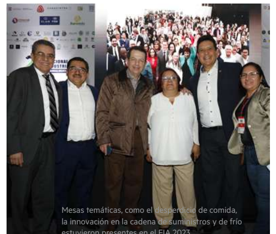
Visitantes de diferentes ámbitos como el académico, el estudiantil y comerciantes estuvieron presentes en el evento.