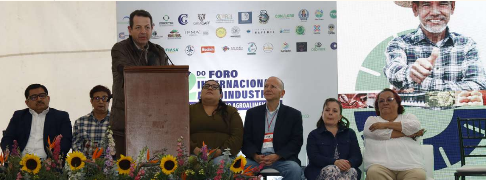
Palabras de agradecimiento del Secretario de Desarrollo Económico de la Ciudad de México durante la clausura del evento.

Gracias a todos los involucrados en el FIA por la confianza depositada en SEDECO de la CDMX y en mi persona para formar parte de este extraordinario equipo. 🌍