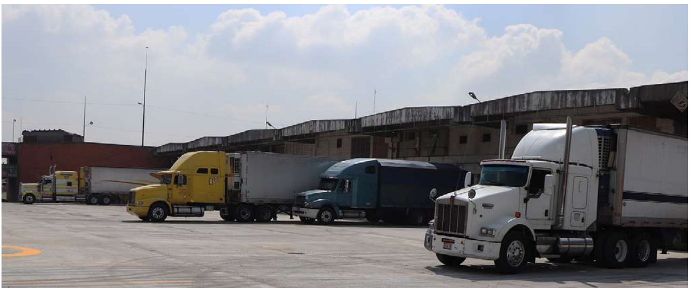
Patios de maniobras de la Central de abasto.