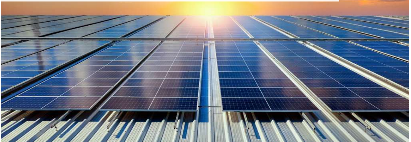
La instalación de paneles solares más grande de América Latina se encuentra en la Central de Abasto.

Considerada como la más grande en el mundo dentro de una urbe, fue concluida y entregada la Planta Fotovoltaica de la Central de Abastos de la Ciudad de México, conformada por 30 mil paneles solares sobre una superficie de 21 hectáreas que abarca 21 naves comerciales. Este proyecto generará la energía eléctrica equivalente a la electricidad que requieren diez mil hogares de la capital de México y fue entregada por el jefe de Gobierno capitalino, Martí Batres.