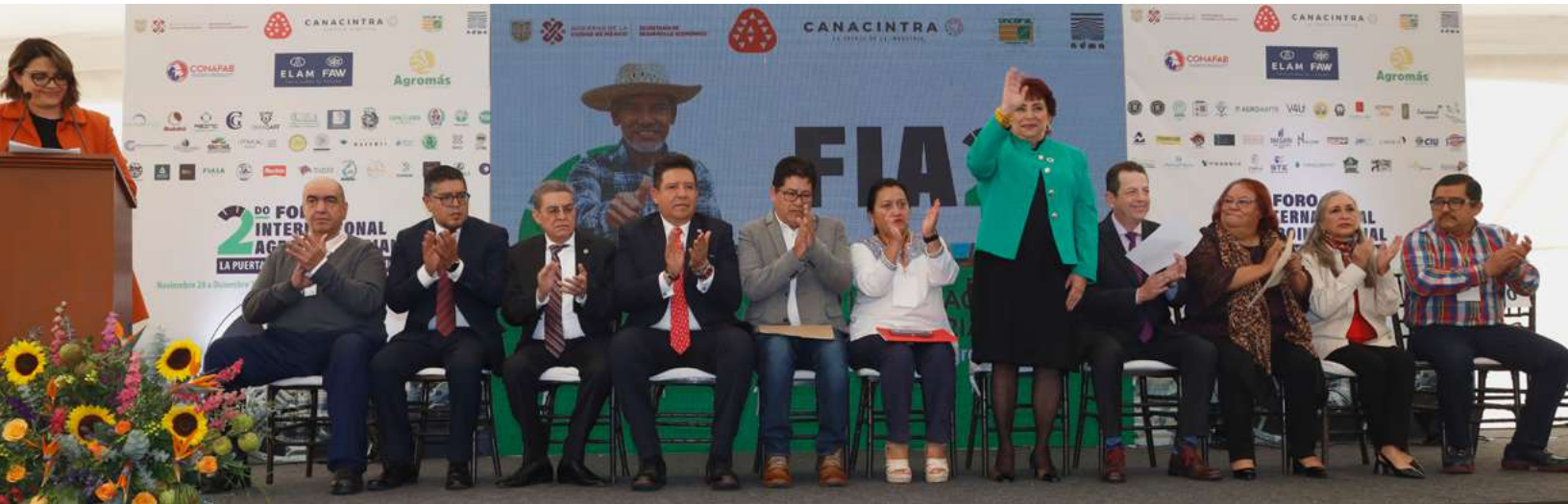
La Presidenta nacional de Canacintra, Esperanza Ortega Azar, encabeza la inauguración de Foro Internacional Agroindustrial 2023.

E l Sector Agroindustrial de la Canacintra es el más reciente en conformarse dentro de nuestra Cámara y en pocos años ha generado valiosas ideas para impulsar la agroindustria nacional y la cadena agropecuaria.