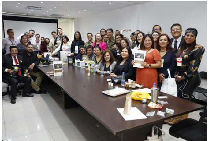
Durante los cuatro días de actividades del FIA 2023 se realizaron multimedias, sesiones de networking y enlaces comerciales.