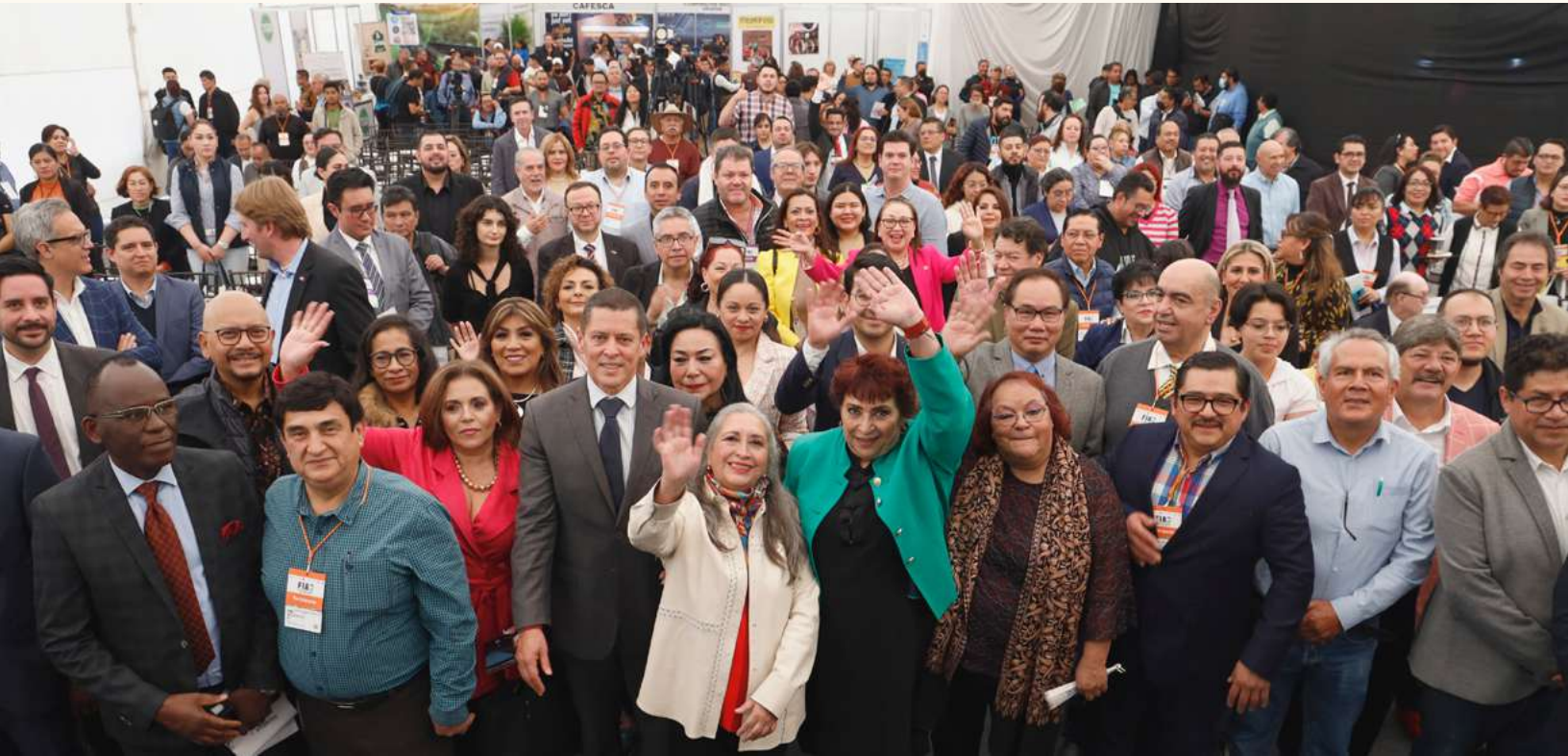
Representantes diplomáticos, empresarios, autoridades y líderes de la Central de Abasto, la Presidenta de Canacintra y miembros del Sector Agroindustrial de esta cámara en la foto familiar del FIA 2023.

mentario, y sorprenderme no sólo de su importancia, sino también de su potencial futuro, en especial ante el reto de forjar la autosuficiencia alimentaria como un objetivo básico para México.