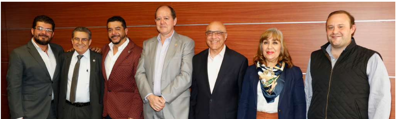
Mesa directiva y presidencia del Sector Agroindustrial de Canacinttra que inició labores este marzo de 2024

Desde entonces, el Sector Agroindustrial de la Canacinttra ha demostrado una notable capacidad para generar actividades de promoción, y con base en ese principio, es que surge la idea de crear el Foro Internacional Agroindustrial , mismo que toma forma en el 2022 y que hoy es parte fundamental de su agenda de trabajo.