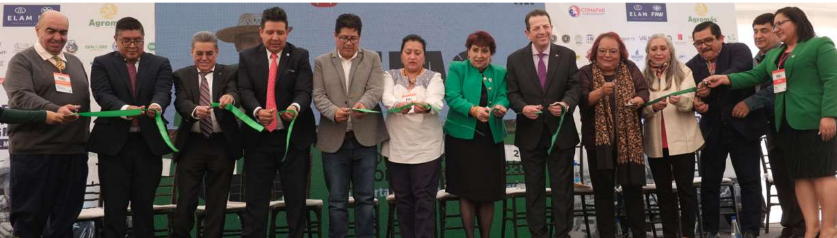
El pleno de autoridades de la Central de Abasto, la Presidenta y Vicepresidentes de Canacintra, así como el Secretario de Desarrollo Económico durante el corte de listón inaugural.

Después de dos días de actividades, el jueves 30 de noviembre de 2023 tuvimos la ceremonia inaugural oficial del 2do Foro Internacional Agroindustrial, en la que se ofrecieron los mensajes de las organizaciones que encabezaron este evento.