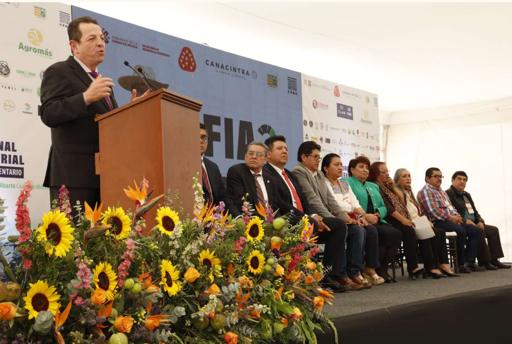
El Secretario de Desarrollo Económico de la Ciudad de México, Fadlala Akabani Hneide, dirige un mensaje durante la apertura de los trabajos del FIA 2023.

Este evento me permitió conocer mejor el sector agroali-